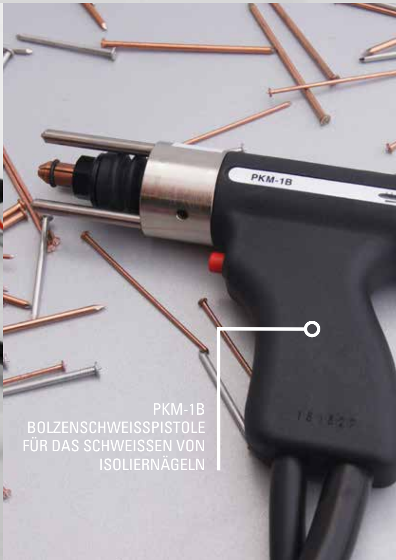
PKM-1B BOLZENSCHWEISSPISTOLE FÜR DAS SCHWEISSEN VON ISOLIERNÄGELN