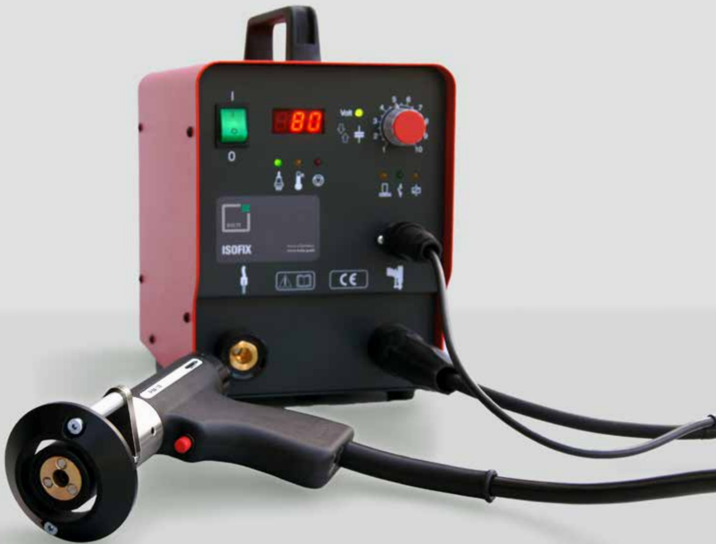
PIM-1B BOLZENSCHWEISSPISTOLE FÜR DAS SCHWEISSEN VON TELLERSTIFTEN