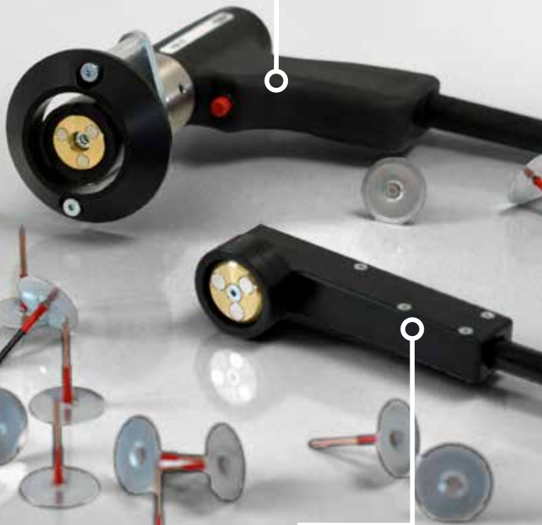
PIM-1K KOMPAKTE BOLZENSCHWEISSPISTOLE FÜR DAS SCHWEISSEN VON TELLERSTIFTEN